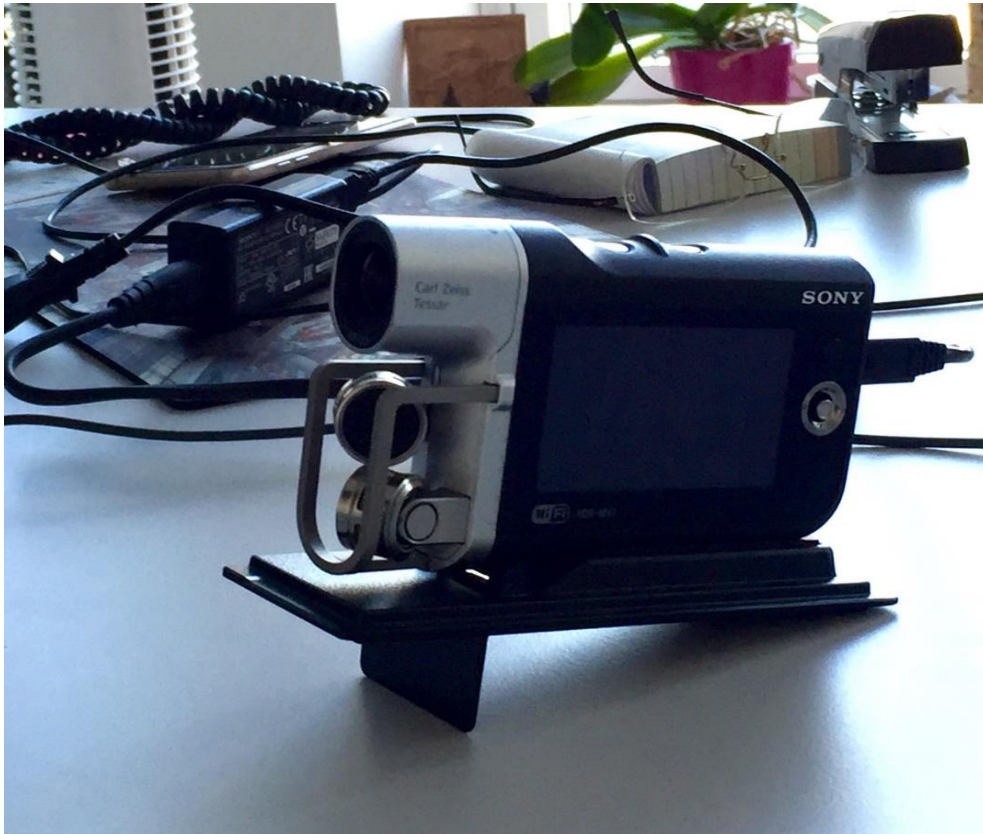
Device used for audiovisual recording of interrogations in the office of an investigating judge